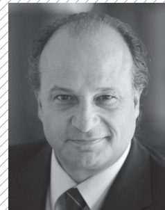
Moderation Filippo Leutenegger, Verleger und Nationalrat